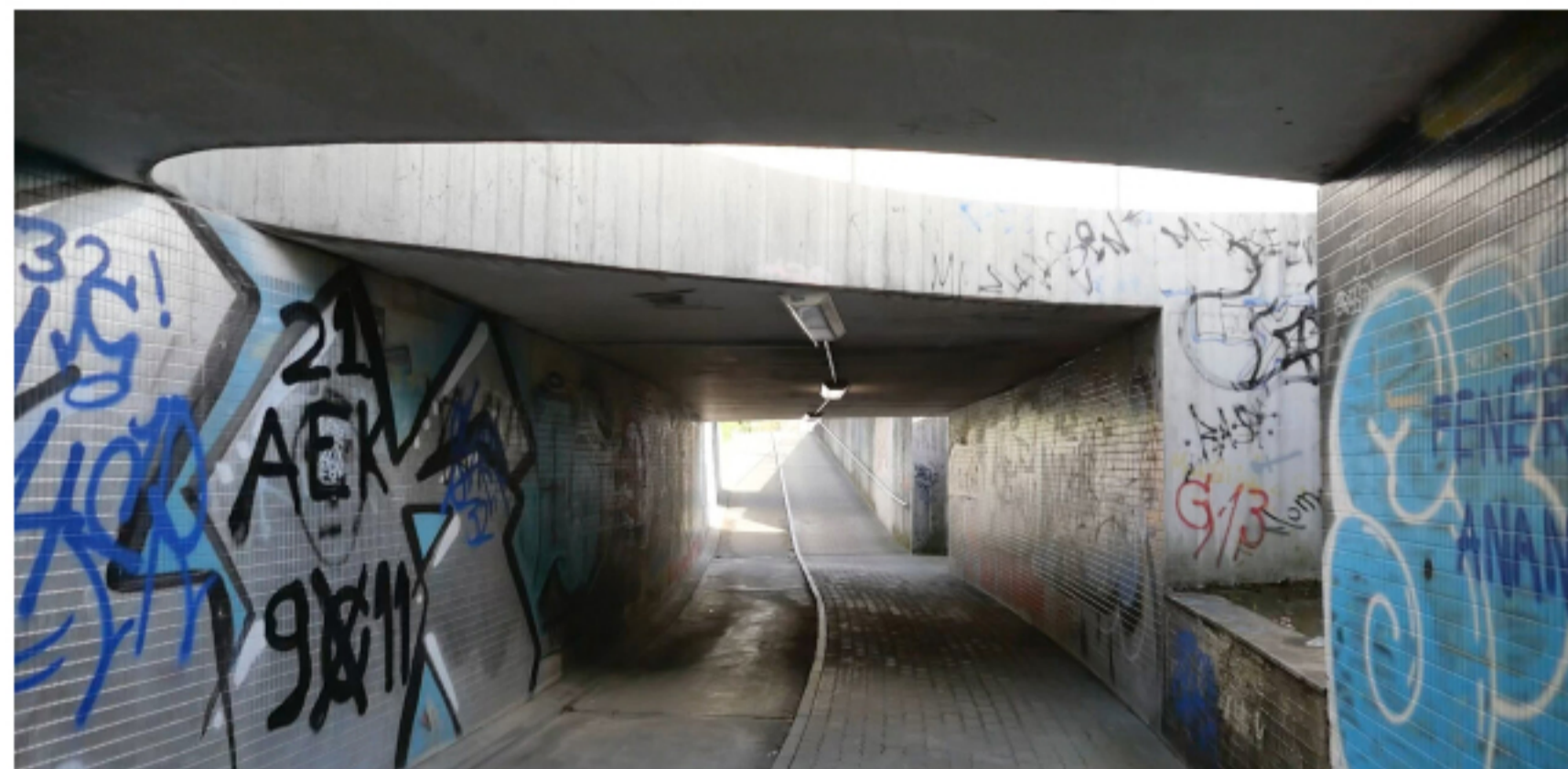
Passage sous la Birsfelderstrasse, Muttentz

En présentant le passage aménagé sous la Birsfelderstrasse , les étudiantes et étudiants de la FHNW ont consciemment choisi d'attirer l'attention sur un lieu apparemment insignifiant, d'aucuns diraient même un non-lieu. Il vaut cependant la peine de prendre le temps d'observer cet endroit où la plupart des gens se dépêchent de passer, perdus dans leurs pensées. Les cyclistes déboulent à toute vitesse, les piétonnes et piétons se croisent, laissant parfois des traces, temporaires ou permanentes. Les solutions aménagées pour l'éclairage et le choix des matériaux révèlent des qualités surprenantes.