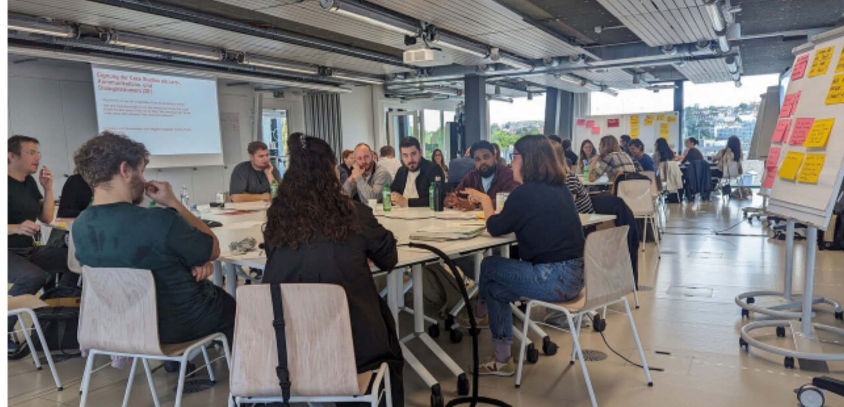
Atelier Culture du bâti Suisse et hautes écoles à Zurich